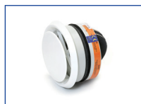
Brandwerende vlinderklep met afzuigventiel SCV+60