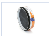
Brandwerende vlinderklep SC+60