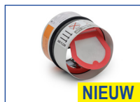
Brand- en rookwerende vlinderklep SC60-COSMO