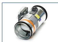
Geoptimaliseerde brandklep 60 min. CR60M