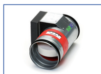
Brandklep 120 min. CR2C