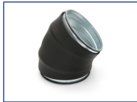
Segmentbocht 45° dampdicht R=1xd RBDI4