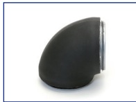
Geperste bocht 90° kort dampdicht R<1xd GBSDI9