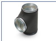
T-stuk 90° dampdicht TDI9