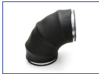
Segmentbocht 90° dampdicht R=1xd RBDI9