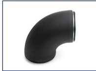
Geperste bocht 90° dampdicht R=1xd GBDI9