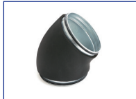
Geperste bocht 45° dampdicht R=1xd GBDI4