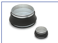
Verloop dampdicht VDI