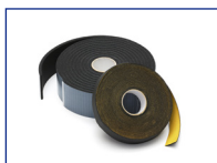
Elastomeer afdichtband zwart ETDI

Dampdicht assortiment verkrijgbaar tot en met Ø400 mm