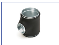
T-stuk 90° dampdicht RTDI9